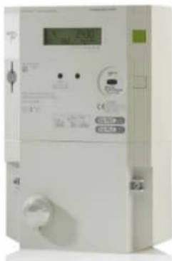
Bedienung Smart Meter

am: Freitag, 11. Oktober 2024 von: 18 00 bis 20 00 Uhr im: Spittel Kaiserstuhl